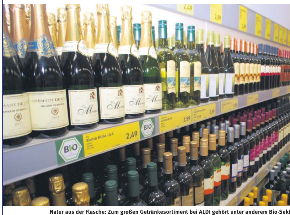
Natur aus der Flasche: Zum großen Getränkesortiment bei ALDI gehört unter anderem Bio-Sekt.

Einkaufen ohne lange zu suchen – und alles in Top-Qualität zu verlässlich günstigen Preisen. Auf 800 Quadratmetern finden Sie: